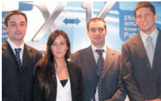
DVELOP. Una de las empresas ganadoras del programa Promesas